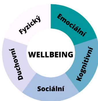
Wellbeing rozvíjí 5 aspektů lidského potenciálu

Wellbeing je stav, ve kterém můžeme v podporujícím a podnětném prostředí plně rozvíjet svůj potenciál a žít spokojený život. Dle šetření PISA bylo zjištěno, že 30 % českých žáků je obětí šikany a 18 % není spokojeno se svým životem. Šetření TIMSS opakovaně ukázalo, že čeští žáci školu navštěvují nejméně rádi ze všech zemí OECD. Wellbeing ve vzdělávání je ovšem orientovaný nejen na žáky, ale i učitele, jejichž psychická pohoda je klíčová k zabezpečení bezpečného klimatu ve výuce a dosažení vzdělávacích cílů. “Vzdělávací výsledky a wellbeing jsou spojené nádoby“, prezentovala Lenka Felcmanová vedoucí Pracovní skupiny Wellbeing .